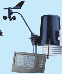
Davis Weather Station