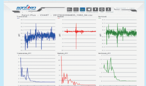
Web Monitoring System