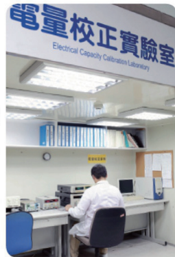
設置 CNLA 電量校正實驗室，強化產品品質與標準化