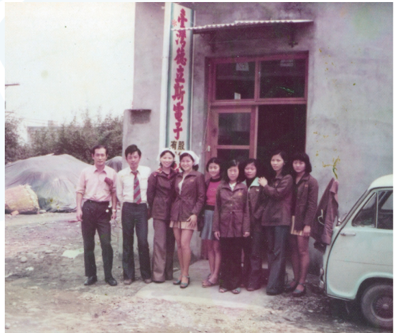
▲ 草創期板橋和平路工廠；老照片被時間侵蝕了，胼手胝足開創新局的記憶卻依然鮮明

（Speedy Service with Sincerily），並全力實踐「專業化、標準化、簡單化」（Specialization, Standardization, Simplification）的3S品質政策。