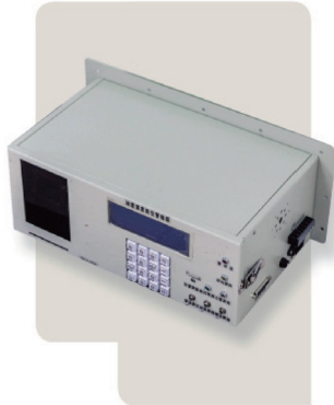
與三聯科技合作生產第一代地廣覆度數位充電器