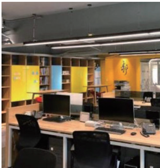
▲ 靜中帶爭—集團45年歷史，保持心態的年輕，吸引青年優秀人才加入，提高競爭力。

四十年來，德立斯猶如一個大家庭，各項榮耀的背後都是每一位員工辛勞的成果。為感謝他們的付出，德立斯以高於法令的標準，足額提撥了全體同仁的勞退基金，讓每一位屆退員工都先結清退休金，之後重新回聘，讓員工都能無後顧之憂地繼續在崗位上發揮專長、傳承經驗。此外，德立斯人性化的工作環境以及傲視同業的福利制度，堪稱小而美、小而精的幸福企業。