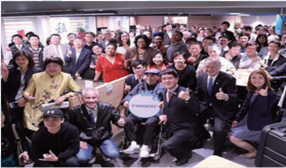
▲ 德立斯T Lab創新創業加速器開幕，佳賓冠蓋雲集